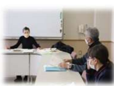
本町地区の地域福祉サポーターの皆さん