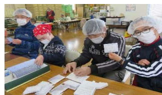
カードホルダー折り作業