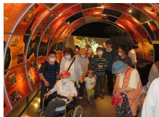
社会見学 (ねぶたの家W・ラッセ見学)