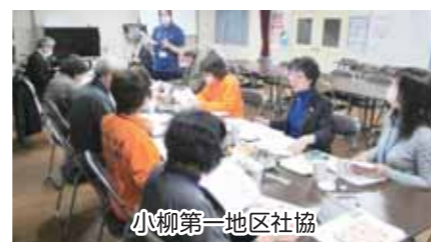
小柳第一地区社協

地域支え合い推進員は、ここ高齢者給食サービスをはじめ、邪魔させていただき、地域を知っています。また地域の困りごと合う場「地域支え合い会議」を実施しています。現在、過去に行われた支え合い会議の内容を各地区の会議等で紹介をしています。