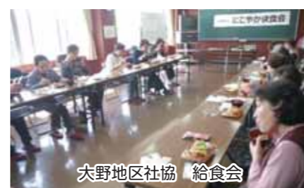
大野地区社協 給食会

まっけて組織された団体で、青森区、地域の特徴を活かした様々皆様も地区社協活動へご理解、