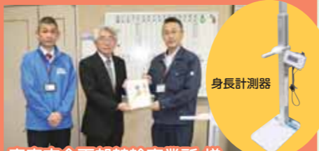
青森市企画部競輪事業所様 日本トーター株式会社青森競輪事業所様