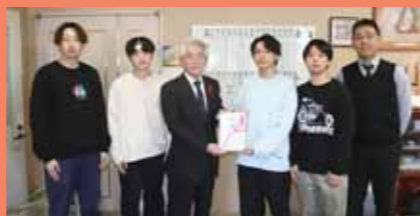
あおもりコンピュータ・カレッジ様

皆様より寄せられました善意は、 地域福祉充実のため有効に 使わせていただきます。