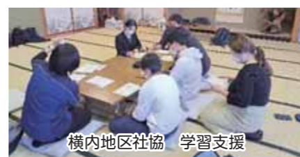
横内地区社協 学習支援

地区社協とは…町会が複数集市内に38地区あります。各様な福祉活動を展開しております。ご協力をお願いいたします。