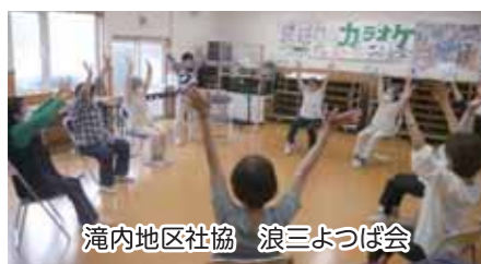
滝内地区社協 浪三よつば会

年を重ねても明るく、健康で楽しく過ごしたいという高齢者の願いを叶えるために、地域の交流の場(サロン)をつくり、生きがいを進め、生活にメリハリを出すことにより閉じこもりの防止や認知症、寝たきりを予防することを目的として昨年度は、青森市内38地区社協各109所で開催しています。