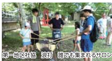
第一地区社協 浪打 誰でも集まれるサロン