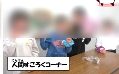
人間すごろくコーナー

赤い羽根 共同募金にご協力いただき、ありがとうございました。 集まった募金750円は、青森市 共同募金委員会に全額寄付させていただきました。