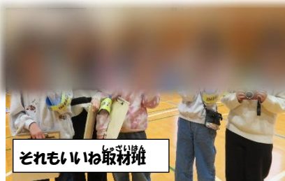
それもいいね取材班