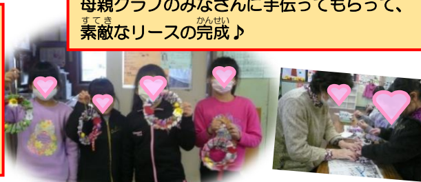
母(ぼ)親(しん)ク(ク)ラ(ラ)ブ(ブ)の(の)みな(みな)さん(さん)に手(て)伝(でん)わ(わ)ら(ら)って(て)、素(す)敵(てき)な(な)リ(リ)ー(ー)ス(ス)の(の)完(かん)成(せい)♪