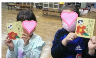
三内(さんない)地(ち)域(いき)に住(す)んで(んで)い(い)る(る)一(ひと)人(ひとり)喜(よろこ)ば(ば)し(し)の(の)高(こう)齢(れい)者(しゃ)の(の)方(かた)へ「い(い)つ(つ)ま(ま)で(で)も元(げん)気(き)で(で)い(い)て(て)くだ(くだ)さい(さい)」とメ(メ)ッ(ッ)セ(セ)ー(ー)ジ(ジ)を(を)書(か)いて(いて)年(ねん)賀(が)色(しき)紙(し)を(を)作(つく)り(り)ま(ま)した(した)。

今年(ことし)度は感(かん)染(せん)症(しょう)拡(かく)大(だい)防(ぼう)止(し)のため(ため)に中(ちゆう)止(し)となる行(ぎょう)事(じ)もあ(あ)りま(ま)した(した)が、子(こ)ども(ども)た(た)ち(ち)は日(ひ)頃(ころ)の児(に)童(どう)館(かん)活(かつ)動(どう)や行(ぎょう)事(じ)を楽(たの)しみに(に)して(して)います(います)。母(ぼ)親(しん)ク(ク)ラ(ラ)ブ(ブ)や運(うん)営(えい)委(い)員(かい)のみな(みな)さん(さん)は「子(こ)ども(ども)た(た)ち(ち)が喜(よろこ)ぶ(ぶ)なら」の思(おも)いで、行(ぎょう)事(じ)の準(じゆん)備(び)や手(て)伝(でん)い(い)など(など)、い(い)つ(つ)もご協(きょう)力(りき)くだ(くだ)さ(さ)って(て)います(います)。子(こ)ども(ども)た(た)ち(ち)は、地(ち)域(いき)の方(かた)と他(た)愛(あい)のな(な)いお話(わ)を(を)し(し)て(て)一(いっ)緒(しょ)に過(あ)ご(ご)すこと(こと)が(が)でき(き)て(て)、楽(たの)し(し)さ(さ)や安(あん)心(しん)を感(かん)じて(じて)い(い)る(る)と思(おも)います(います)。これ(これ)か(か)ら(ら)も児(に)童(どう)館(かん)の活(かつ)動(どう)を(を)通(とお)して(して)、人(ひと)とのつな(つな)がり(がり)のあ(あ)りが(が)た(た)さ(さ)を(を)子(こ)ども(ども)た(た)ち(ち)と(と)も(も)に感(かん)じ(じ)な(な)が(が)ら(ら)、周(まわ)り(り)の(の)人(ひと)へ(へ)の感(かん)謝(しゃ)の気(き)持(も)ち(ち)の大(だい)切(せつ)さ(さ)を(を)伝(でん)え(え)て(て)い(い)き(き)たい(たい)と思(おも)います(います)。