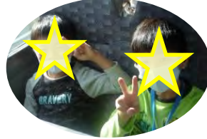
お手玉とけん玉を披露しました！