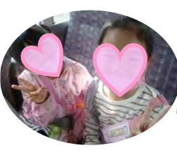
ハンドベルで「夜空ノムコウ」に挑戦です！